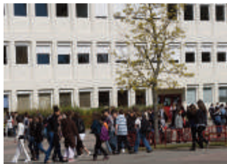
Le collège Jean Zay à Verneuil-sur-Seine.

Le collège Les Châtelaines à Triel-sur-Seine avait grand besoin d'une rénovation, afin que les élèves et leurs équipes pédagogiques puissent travailler dans un cadre harmonieux. J'ai personnellement défendu la demande de rénovation, dans le cadre d'un plan triennal d'investissement, et ce ne sont pas moins de 12 millions d'euros qui seront consacrés aux travaux du collège. En effet, les classes seront entièrement remises à neuf, un nouveau préau sera créé et l'aspect extérieur sera amélioré.