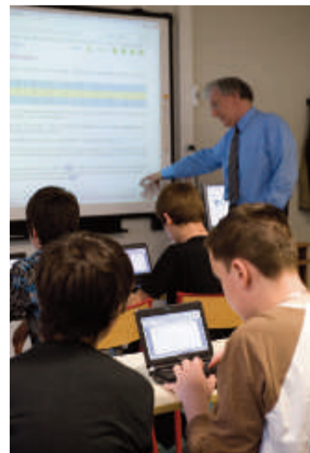
L'expérimentation de Netbooks.