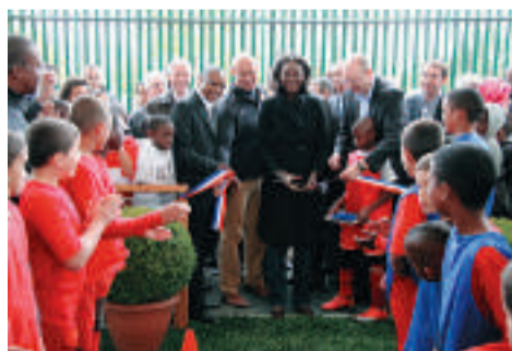
Inauguration par Rama Yade, secrétaire d'État aux sports.

quartier. À l'image du futur Pôle aquatique, dont l'inauguration est prévue à l'automne 2010, le Val Fourré bénéficie avec ces terrains d'un équipement ultra moderne. Surtout, ils répondent à une attente forte des jeunes qui privilégient la pratique du football. ●