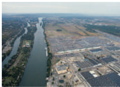
Le site Renault à Flins-les Mureaux.

Flins pour construire les véhicules électriques du futur et les batteries qui vont avec. Toutes ces mesures auront rapidement des conséquences positives dans le canton de Mantel-la-Jolie, notamment en termes de consolidation de l'emploi industriel et de création d'emplois. ●