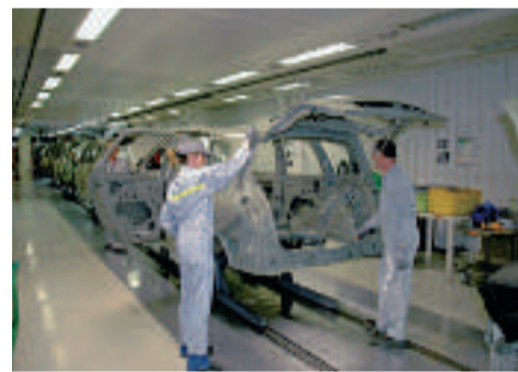
L'emploi est une des priorités de la Vallée de l'Automobile.