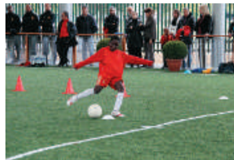
Les jeunes, une priorité pour les nouveaux terrains de football.