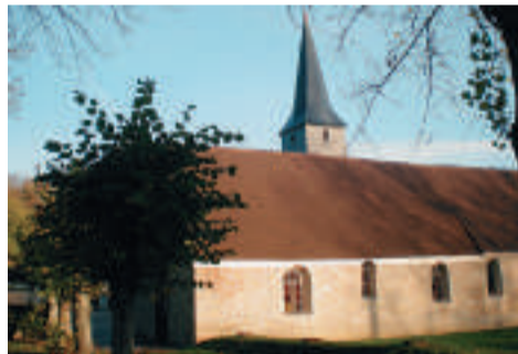
L'église de Courgent.