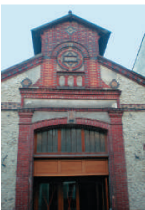
La future salle d'exposition de Houdan.

Le Département a lancé un programme exceptionnel d'aides aux communes pour la restauration et la mise en valeur des édifices protégés ou en péril. Dammartin, Courgent, Richebourg en bénéficient pour leurs églises, Houdan pour transformer une ancienne salle des ventes en salle d'exposition d'arts plastiques.