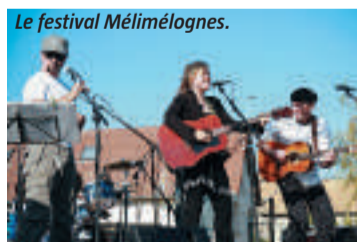
Le festival Melimélognes.