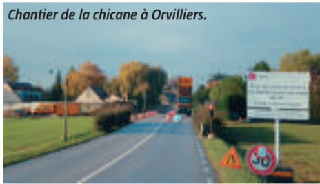
Chantier de la chicane à Orvilliers.

Après la réalisation d'un tourne à gauche pour l'accès à Courgent, celle plus récente d'un double tourne à gauche pour l'accès à Mulcent et Prunay-le-Temple, un chantier vient de s'ouvrir pour installer une chicane à l'entrée d'Orvilliers afin de réduire la vitesse dans la traversée du village.